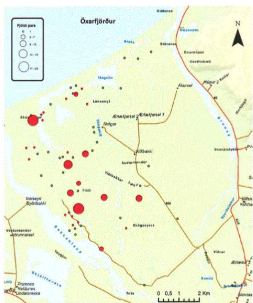
3. mynd. Varpútbreiðsla kjóa (grænt) og skúms (rautt) á Austursandi við Öxarfjörð árið 2009. – The breeding distribution of Arctic Skua (green) and Great Skua (red) in Austursandur, NE-Iceland, in 2009.

Austursandur er þungamiðja flóðsléttu Jökulsár á Fjöllum í Öxarfirði og svæðis sem Náttúrufræðistofnun Íslands skilgreinir sem mikilvægt fuglasvæði. Svæðið var á Náttúruverndaráætlun 2004-2008 en ekki hefur enn komið til friðlýsingar fuglabúsvæða eins og stóð til. Öxarfjörður er enn fremur ein af tillögum Náttúrufræðistofnunar fyrir B-hluta náttúruminjaskrár og er svæðið tilnefnt vegna fugla. Mjög ríkt fuglalíf er á Austursandi og árið 2009 fundust þar við athuganir 36 tegundir sem taldar voru verpa á svæðinu. Þar eru m.a. mikilvæg varplönd skúms, kjóa, svartbaks og lóms. Á nýjasta valista Náttúrufræðistofnunar fyrir fugla sem gefinn var út árið 2018 er skúmur skilgreind sem tegund í bráðri hættu en skúmsvarpið á Austursandi er það eina á norðanverðu landinu. Þá eru bæði kjói og svartbakur skilgreindir sem tegundir í hættu. Einnig er nokkuð kríuvarp á svæðinu en kría telst vera í nokkurri hættu. Austursandur er því mikilvægt búsvæði fyrir tegundir sem standa höllum fæti og það ber að taka alvarlega að mati Náttúrufræðistofnunar. Varp svartbaks, lóms og kjóa er þekkt nálægt Skógalóni og þar eru einnig búsvæði andfugla og vaðfugla t.d. óðinshana. Sjá meðfylgjandi kort. Allar framkvæmdir er tengjast nýtingu jarðhita á svæðinu þurfa að taka tillit til þessa og forðast með öllu að valda raski á varplöndum fugla eða trufla þá á einhvern hátt.