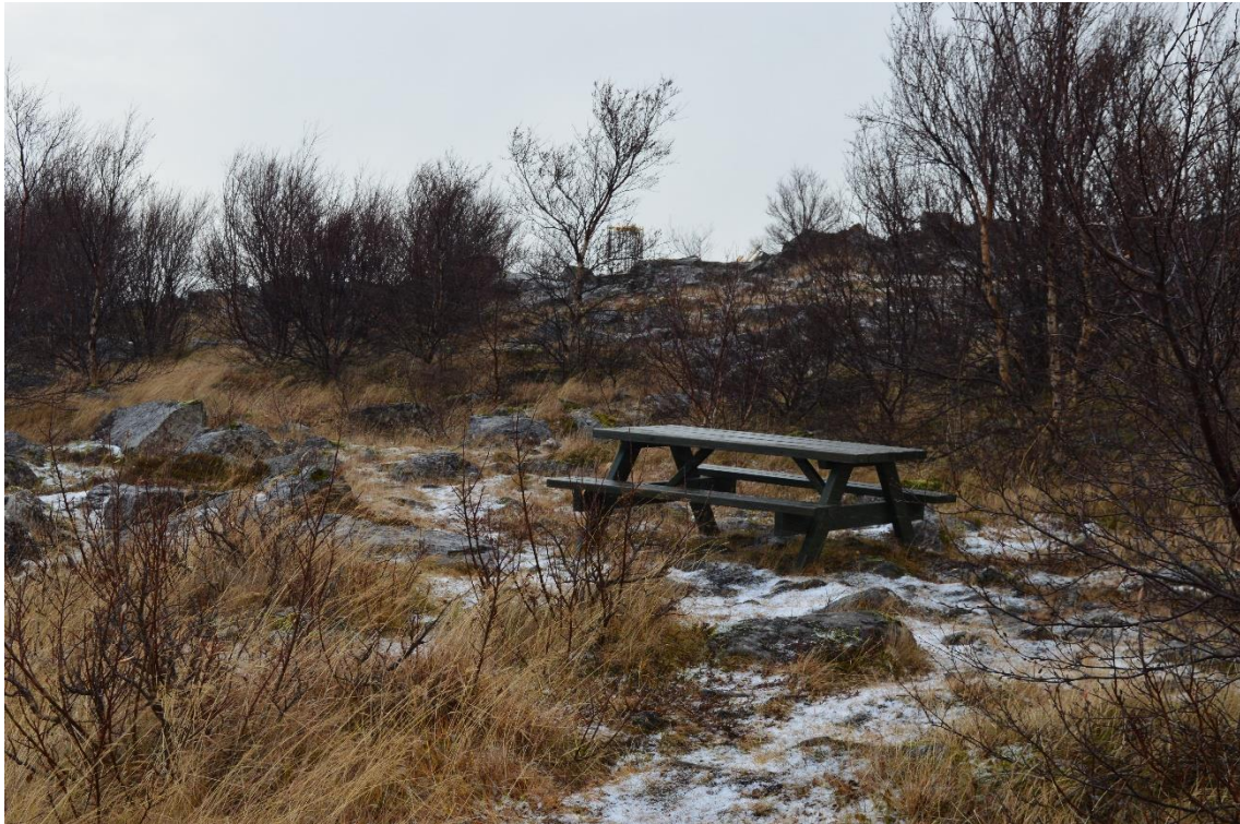
Áningarbekkurinn sést á loftmyndinni (blár hringur) og undirstöður merkisins er rétt fyrir ofan hann. Ljós. Lovísa Ásbjörnsdóttir, 6. nóvember 2020.