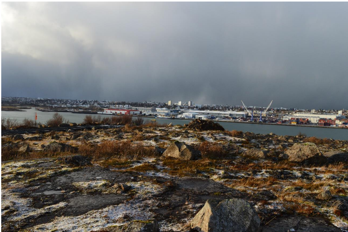
Gamla siglingamerkið lengst til vinstri, undirstöður nýja siglingamerkisins fyrir miðri mynd, uppgröftur til hægri við það og slóðinn að nýja merkinu. Ljós. Lovísa Ásbjörnsdóttir, 6. nóvember 2020.