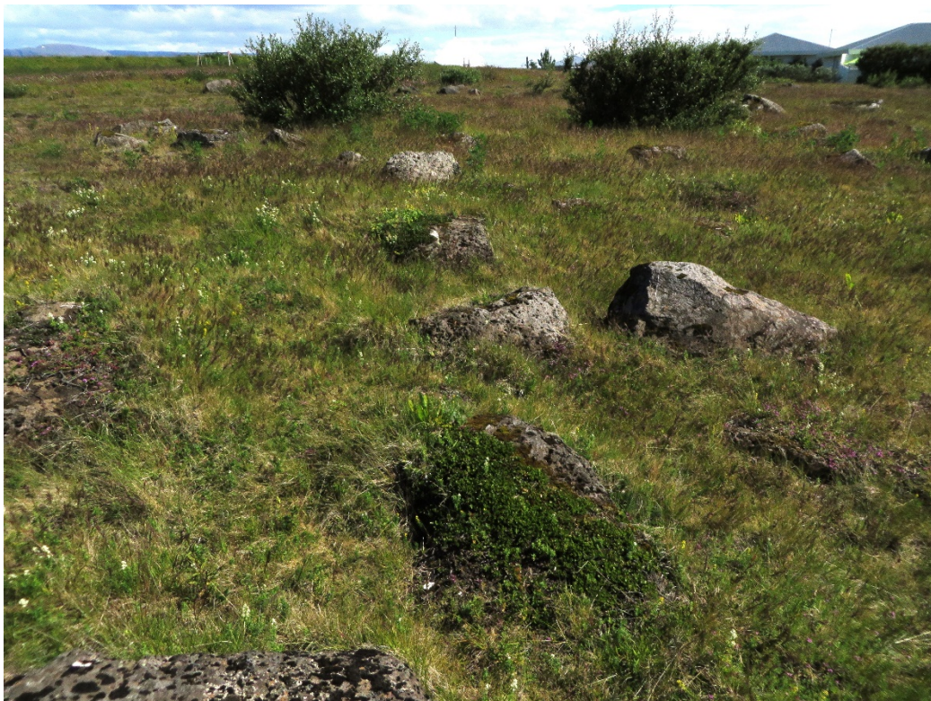
2. mynd. Á mörkum graslandi með blávingli og möðrum og mólendi við norðurjaðar fyrirhugaðra lóðamarka við Kirkjubraut.