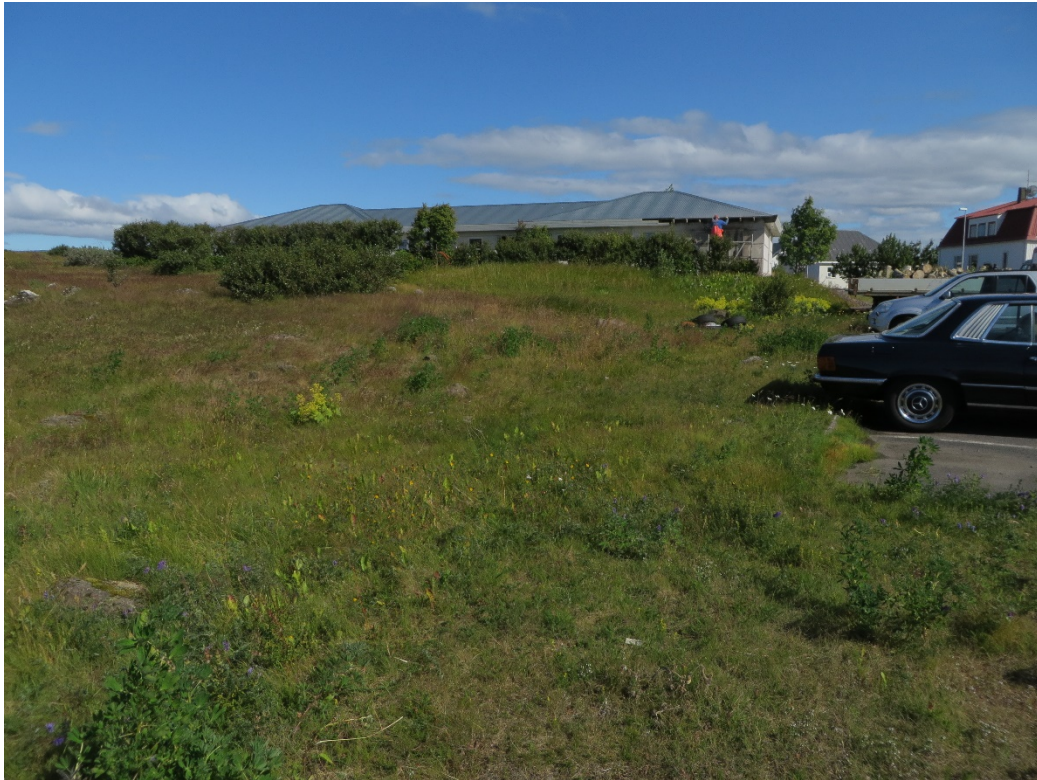
1. mynd. Graslandi við Kirkjubraut 18. Ljós. Guðmundur Guðjónsson 2017.