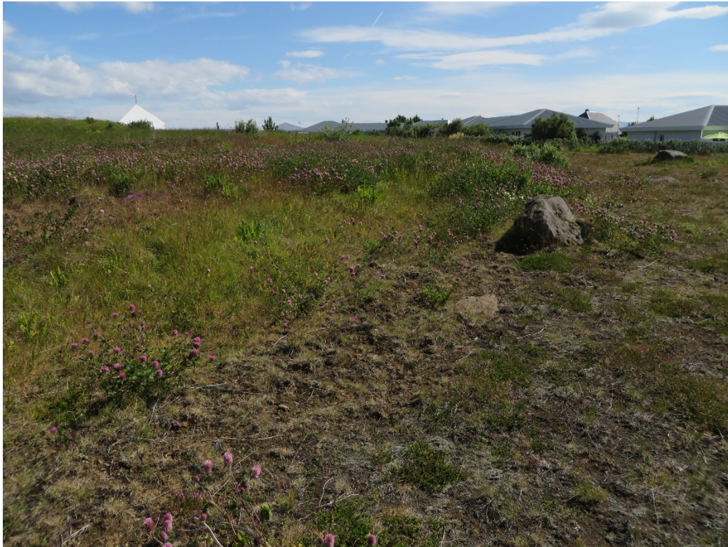
3. mynd. Lynggróður í þurrum og smágrýttum flagmóa við norðurjaðar fyrirhugaðra lóðamarka við Kirkjubraut. Ofan við mólendið tekur gras- og blómlendi við á ný sem er utan lóðamarka. 2017.